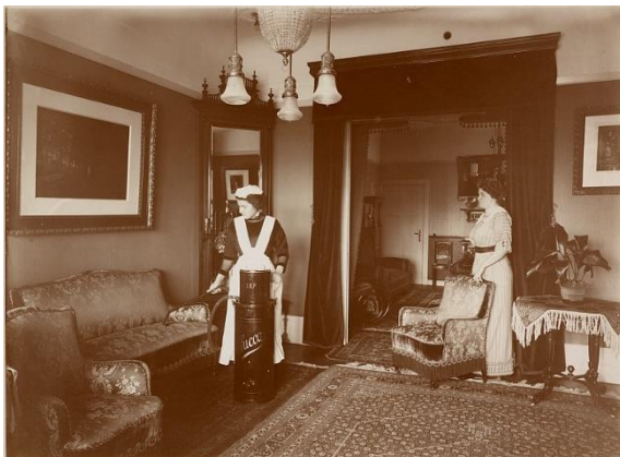
Dienstmädchen unter Aufsicht der Hausfrau, Berlin um 1900, Stadtmuseum Berlin , Reproduktion: Dorin Alexandru Ionita, Berlin

Die Fotografie zeigt die U-Bahn- Baustelle am Heidelberger Platz in einem damals erst teilweise bebauten Teil Wilmersdorfs (heute U3).