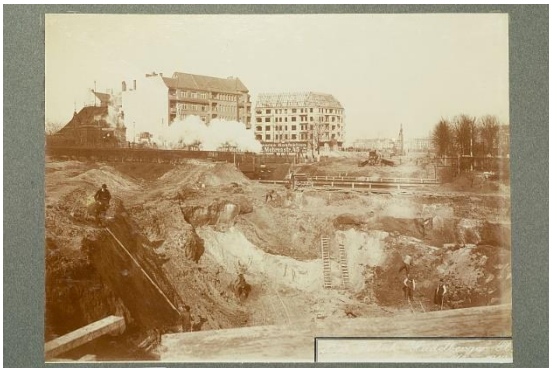
Bau der Wilmersdorf-Dahlemer U- Bahn, Fotoalbum, unbekannter Fotograf (Reproduktion), Wilmersdorf 1910–1913, Museum Charlottenburg- Wilmersdorf , Repro: Ringo Paulusch

Die Fotografie zeigt die Baustelle des prunkvollen Rathauses Charlottenburg in der heutigen Otto-Suhr-Allee.